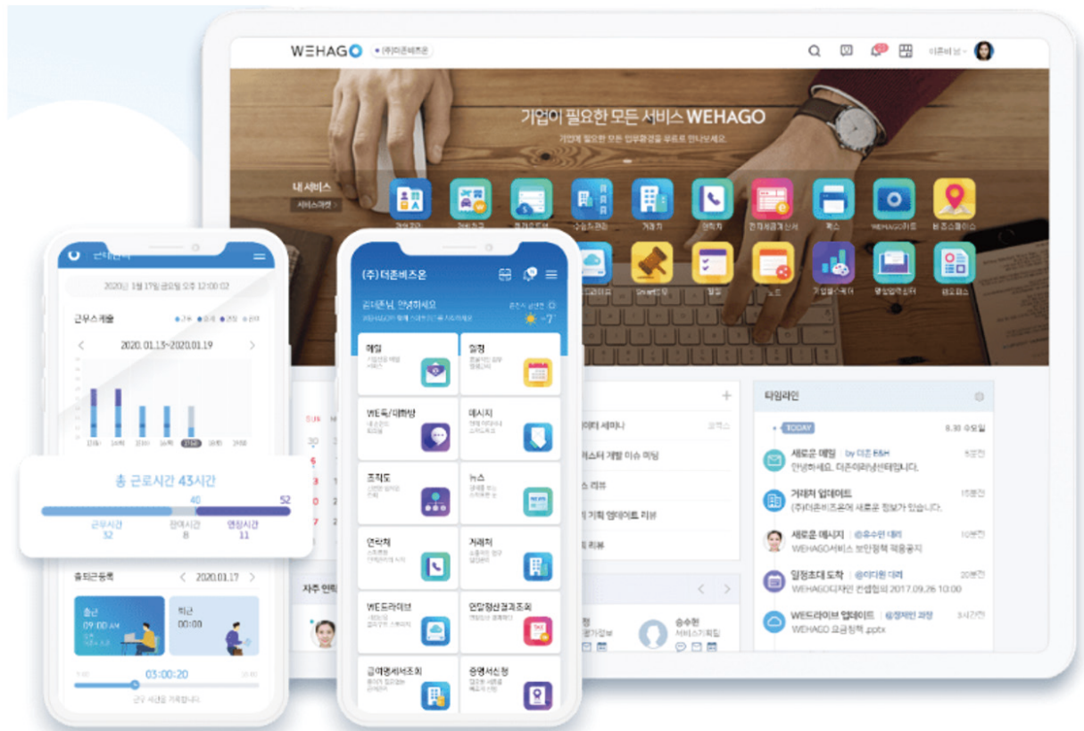
그림 1. 더존비즈온 SaaS 통합플랫폼 'WEHAGO'

더존비즈온은 SaaS 시장의 퍼스트 무버로 도약하기 위한 전략으로 SaaS 통합 플랫폼 생태계 조성을 추진하고 있다. SaaS 통합 플랫폼은 클라우드를 기반으로 다양한 비즈니스 솔루션을 결합하여 하나로 통합·제공하는 플랫폼이다. 이를 통해 더존비즈온은 고객 기업의 디지털 전환을 적극적으로 지원하고 지속 가능한 성장을 돕는 SaaS 통합 플랫폼 기업으로 거듭나고자 한다.